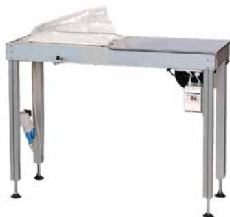
APRISACCHETTO AS400 BAG BLOWER AS400