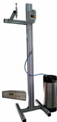
DOSATORE DI AROMI AROMA DOSING SYSTEM