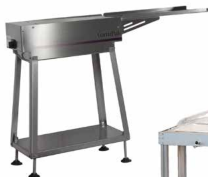
APRISACCHETTO AS300 BAG BLOWER AS300