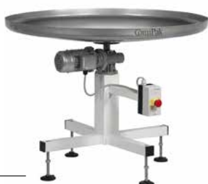
TAVOLO ROTANTE ROTARY TABLE