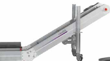
NASTRO TRASPORTATORE CONVEYOR BELT